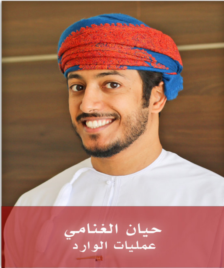
حيان الغنامي عمليات الوارد